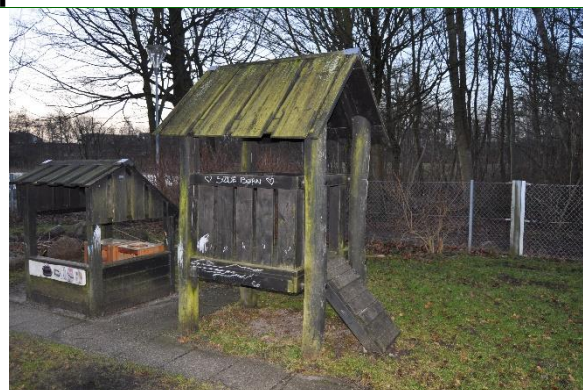
Redskab: Klatretårn Producent: Norleg Er redskabet mærket: Ja Emne 2: Er der registreret fejl / mangler: Ja