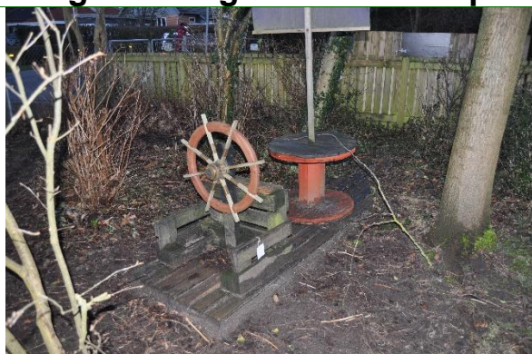
Redskab: Legeredskab Producent: Er redskabet mærket: Nej Emne 1: Er der registreret fejl / mangler: Ja