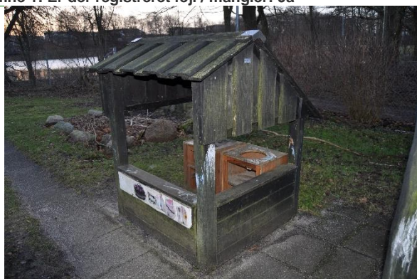
Redskab: Legehus Producent: Norleg Er redskabet mærket: Ja Emne 3: Er der registreret fejl / mangler: Nej