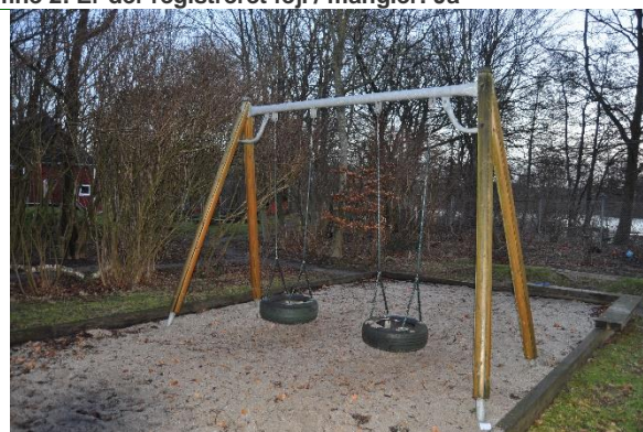
Redskab: Gyng Producent: Norleg Er redskabet mærket: Nej Emne 4: Er der registreret fejl / mangler: Ja